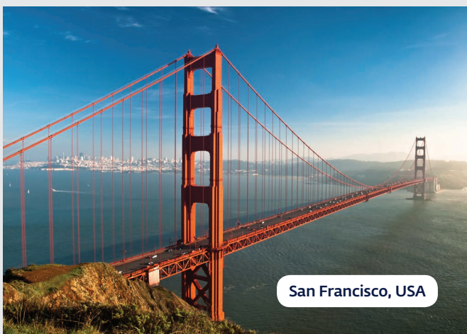
San Francisco, USA