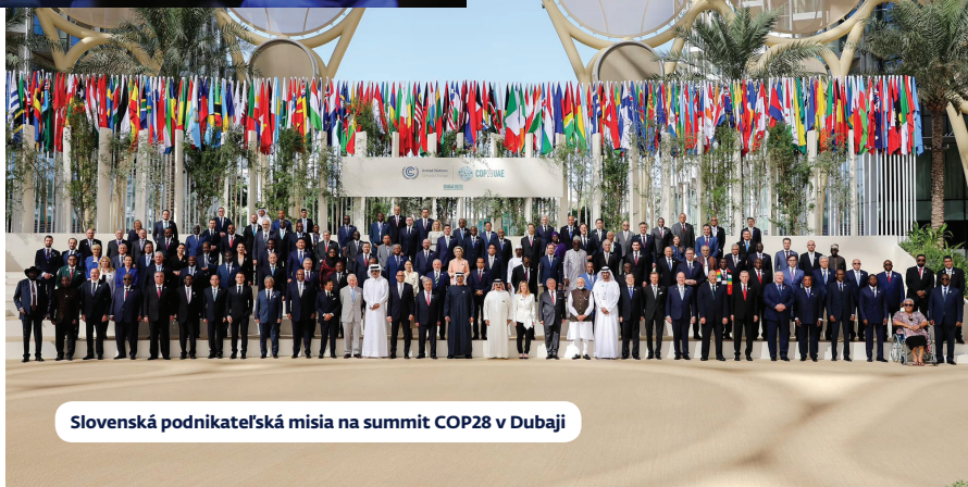
Slovenská podnikateľská misia na summit COP28 v Dubaji

informačné technológie, umelá inteligencia, zelené technológie, obnoviteľné zdroje energie, biotechnológie, elektromobilita