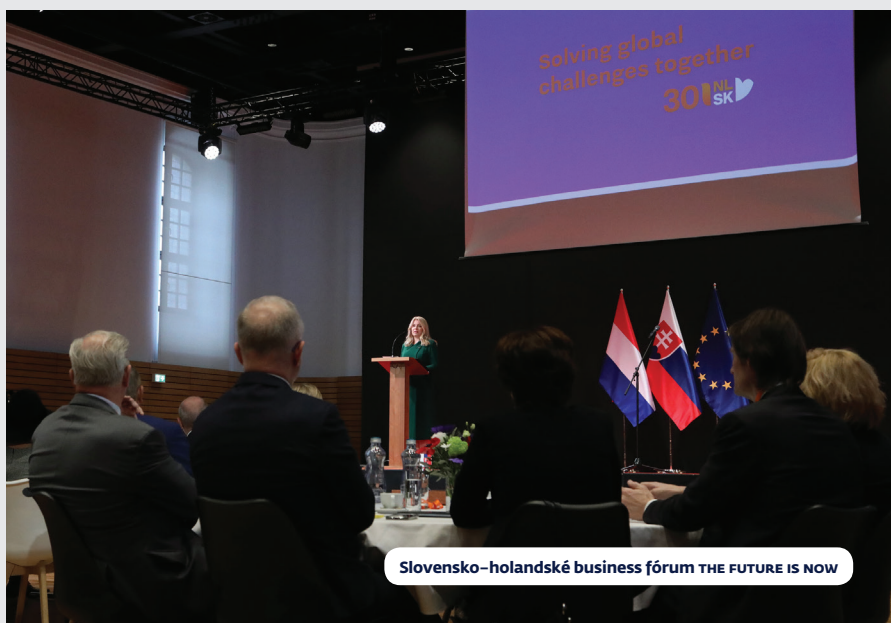
Slovensko-holandské business fórum THE FUTURE IS NOW

Z hľadiska sektorového zamerania jednotlivých aktivít dominovali témy — energetika, obnoviteľné zdroje, čisté a zelené technológie, informačno-komunikačné technológie, manažment odpadového a vodného hospodárstva.