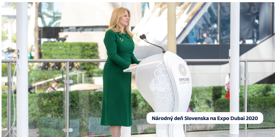
Národný deň Slovenska na Expo Dubai 2020

Podnikateľskej misie zo Slovinska sa zúčastnilo 19 slovenských a 15 slovinských spoločností najmä z oblastí ako energetika, odpadové a vodné hospodárstvo, informatizácia a elektromobilita. Ako počiatočný úspech možno hodnotiť rokovania slovenskej spoločnosti Panara, ktorej sa podarilo so slovinskou spoločnosťou Plastika Skaza dohodnúť návštevu spoločnosti v Slovinsku a zahájiť komunikáciu o nadviazaní obchodných vzťahov. Predmetom obchodných vzťahov by mali byť dodávky bioplastového granulátu vyrobených na báze surovín