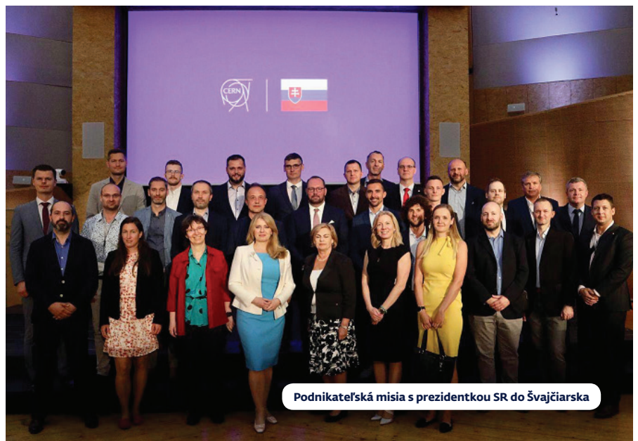
Podnikateľská misia s prezidentkou SR do Švajčiarska

výskum a inovácie, cleantech, obnoviteľné zdroje, obehové hospodárstvo