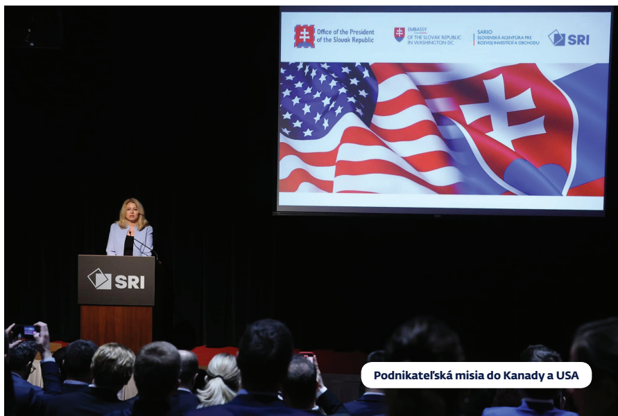
Podnikateľská misia do Kanady a USA